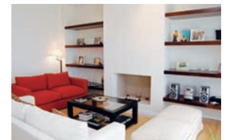
La escalera, de confortable diseño, está iluminada cenitalmente con luz natural. El estar, presidido por el hogar a leños, tiene un perfecto equilibrio de colores, y muebles cómodos que favorecen la reunión familiar y social